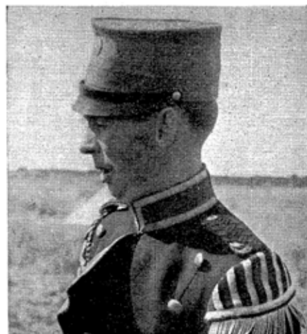
Marskalken iført sin Arbejdsuniform. Galla-Uniformen kan ikke beskrives — den er intet mindre end et Mareridt.