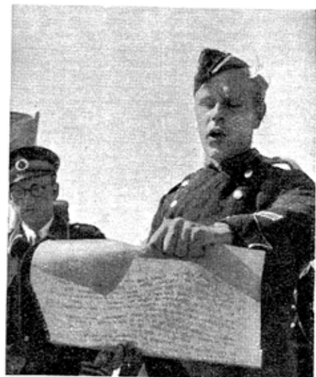
Ceremonimesteren oplæser Haandfæstningen med gravitetsk Røst ..