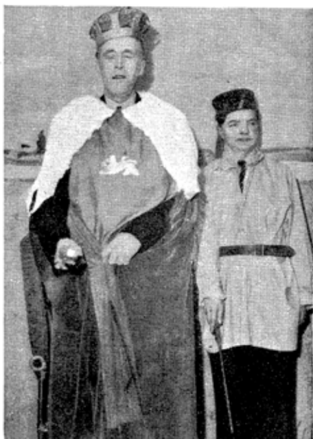
Folkets jublende Hyldest skyller mod Kong Erik af Elleore, og han lukker betaget Øjnene til Larmen stilner af.