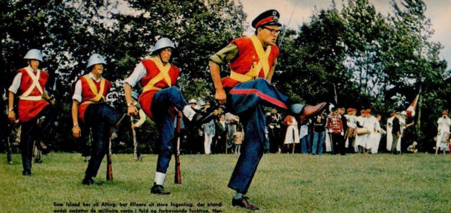
Som Island har sit Alting, har Elleore sit store Tingting, der blandt andet omfatter de militære corps i fuld og forbavsende funktion. Herover viser landmilitsen således sin karakteristiske parademarch, der aldrig undlader at gøre et gribende indtryk på tilskuerne. Til højre ses det elliske hof med damer. I tronstolen Hs. Kgl. Høyhed Arveprinsen.

DET mindste kongerige i hele verden er så lille, at der ikke engang er et hus i det. Landets borgere må overnatte i telte. Det lille land er kongeriget Elleore i Roskilde Fjord, 3 1/2 td. land stort (altså som Rådhuspladsen i København), omgivet af vand på alle sider og beliggende fire kilometers drageflugt nord for Roskilde.