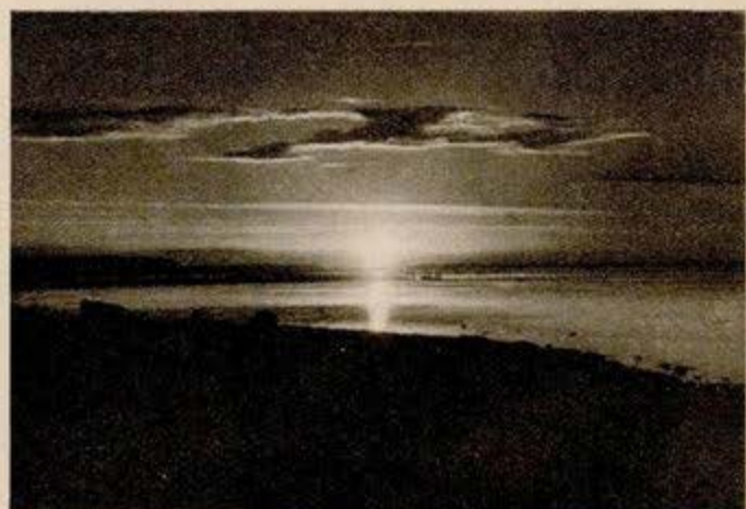
Til venstre er elliske statsborgere ved at dyrke det nationale spil krachet, mens billedet til højre viser, hvor stemningsfuldt det vestlige Elleore og forvandet omkring det tager sig ud ved solnedgang.